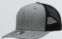
HEATHER GREY / BLACK