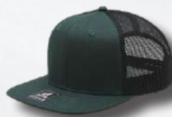
DK GREEN / BLACK