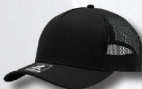
BLACK / BLACK