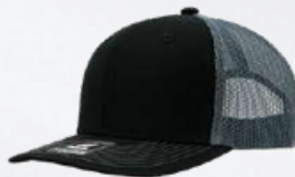
BLACK / OXFORD