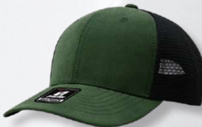
OLIVE / BLACK