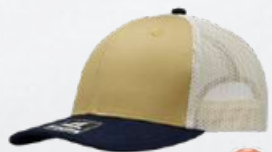
CORN / NAVY / STONE