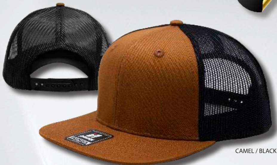
CAMEL / BLACK