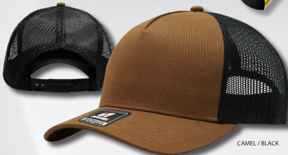
CAMEL / BLACK