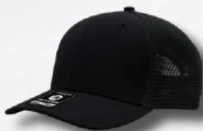
BLACK / BLACK