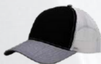
BLACK / HEATHER GREY / WHITE