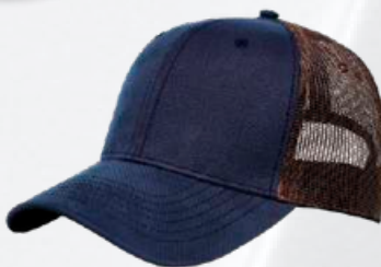
NAVY / LT BROWN