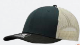
GREEN DK / BROWN / STONE