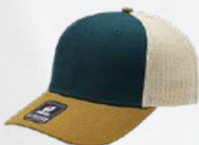
STEEL / CAMEL STONE