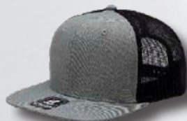
HEATHER GREY / BLACK