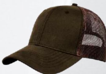
BROWN / BROWN