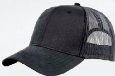
GREY / OXFORD