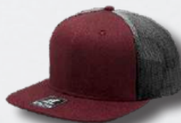
WINE / OXFORD