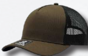
BROWN / BLACK