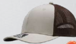
STONE / BROWN