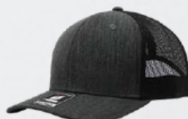
HEATHER BLACK / BLACK