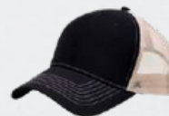
BLACK / KHAKI