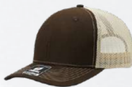
BROWN / STONE