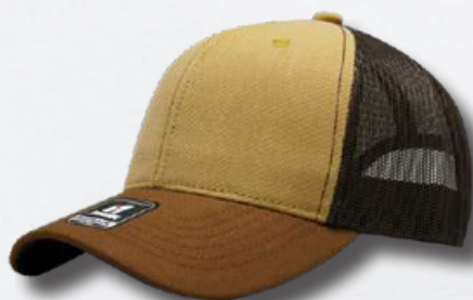
MUSTARGE CAMEL BROWN