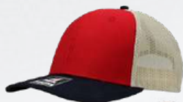
RED / BLACK / STONE