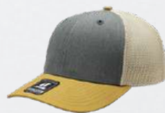
HEATHER GREY / MUSTARD / STONE