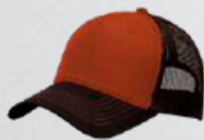
TX ORANGE / BROWN