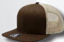
BROWN / KHAKI