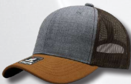
HEANTHER GREY CAMEL BROWN