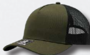
OLIVE / BLACK