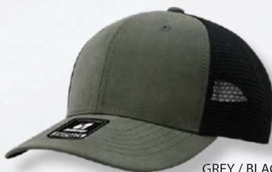
GREY / BLACK