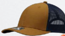
MUSTARD / NAVY