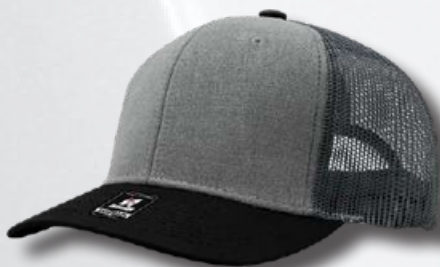
GREY / BLACK