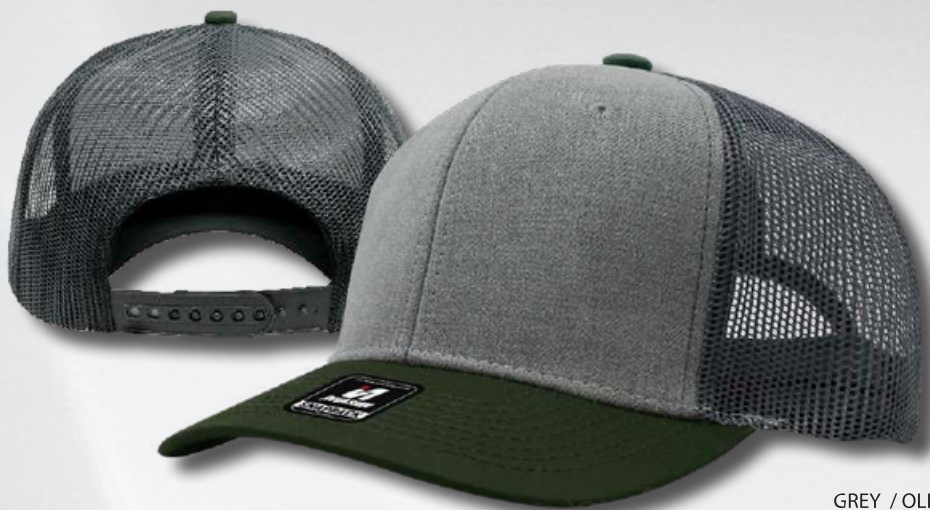
GREY / OLIVE