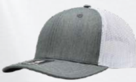
HEATHER GREY / WHITE