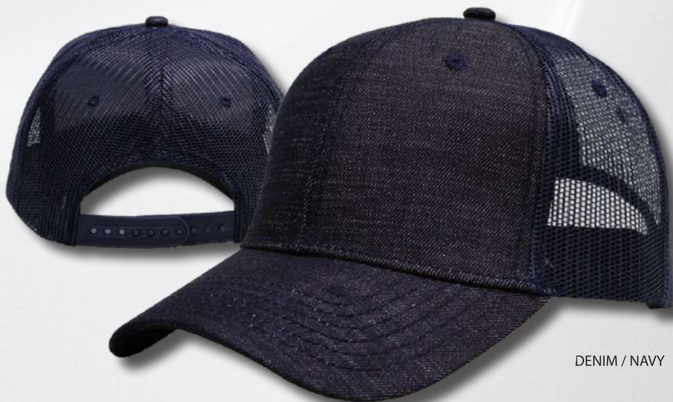
DENIM / NAVY