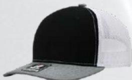
BLACK / HEATHER GREY / WHITE