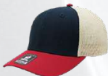
NAVY / WINE / STONE