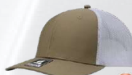
KHAKI / WHITE