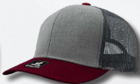
GREY / BURGUNDY