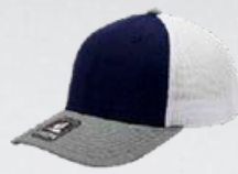
NAVY / HEATHER GREY / WHITE