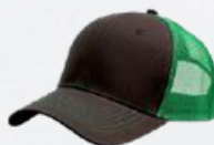
OLIVE / GREEN