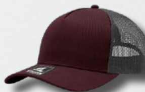
WINE / OXFORD