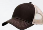
BROWN / KHAKI