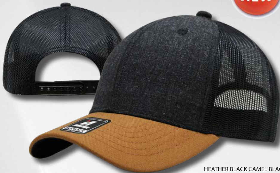
HEATHER BLACK CAMEL BLACK