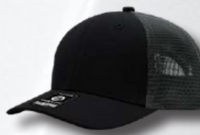
BLACK / OXFORD