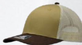
CORN / BROWN / STONE