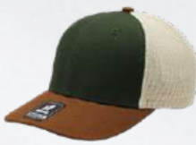
OLIVE / BROWN / STONE