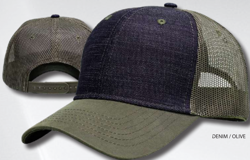
DENIM / OLIVE