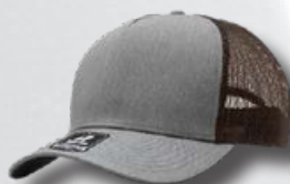
HEATHER GREY / BROWN