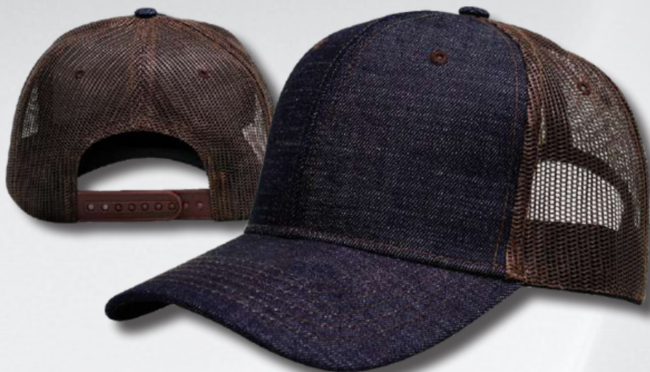
DENIM / BROWN