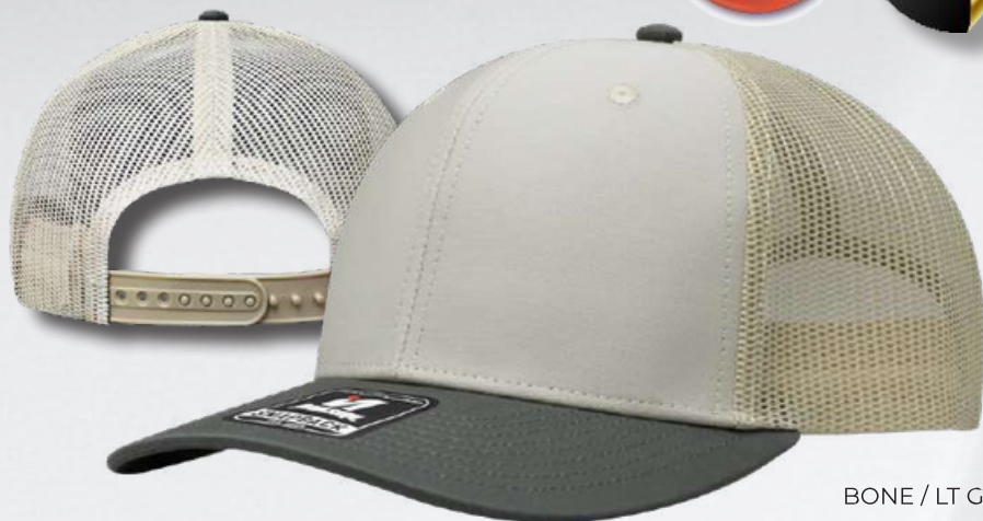
BONE / LT GREY /