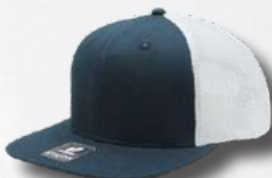
NAVY / WHITE