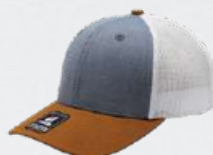
BLUE / CAMEL / WHITE