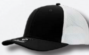
BLACK / WHITE