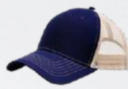
NAVY / KHAKI