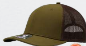
MOSS / BROWN