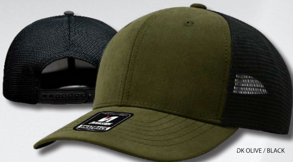
DK OLIVE / BLACK