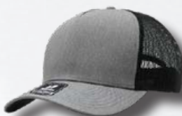
HEATHER GREY / BLACK