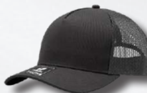
CHARCOAL / OXFORD