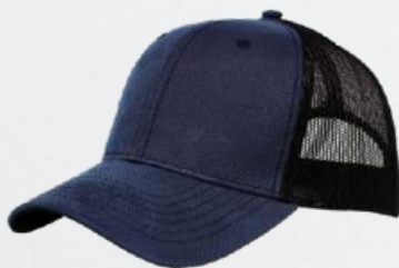
NAVY / BLACK