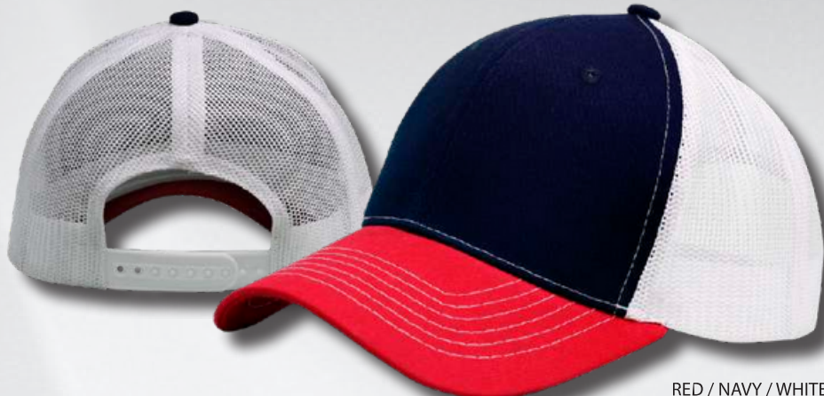
RED / NAVY / WHITE