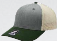
HEATHER GREY / OLIVE / STONE