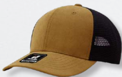
CAMEL / BLACK