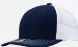
NAVY / WHITE