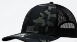
BLACK / CAMO