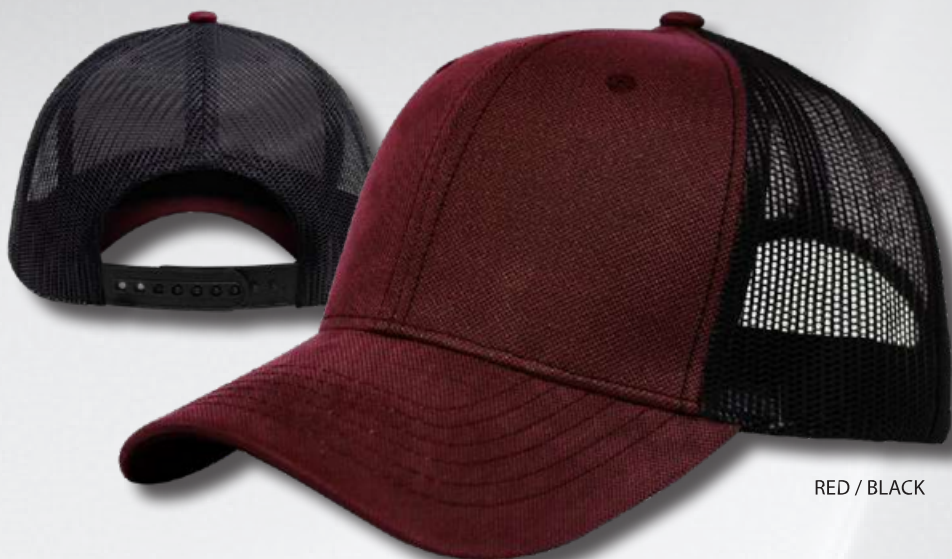
RED / BLACK